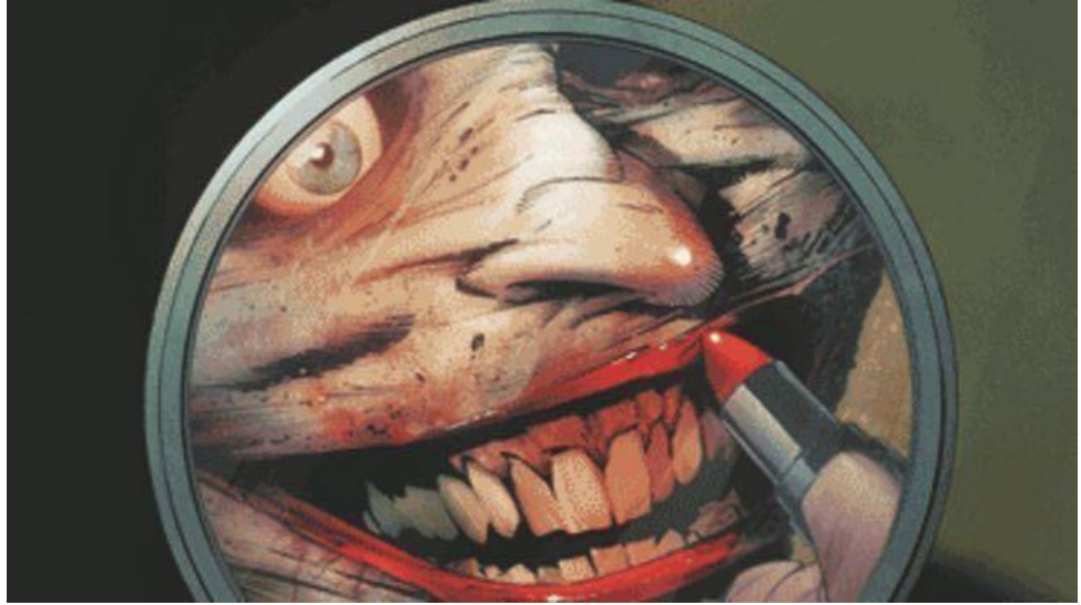
Imagen 5. Greg Capullo & Scott Snyder