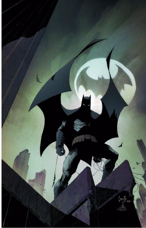
Imagen 2. Batman “Los nuevos 52” Greg Capullo & Scott Snyder