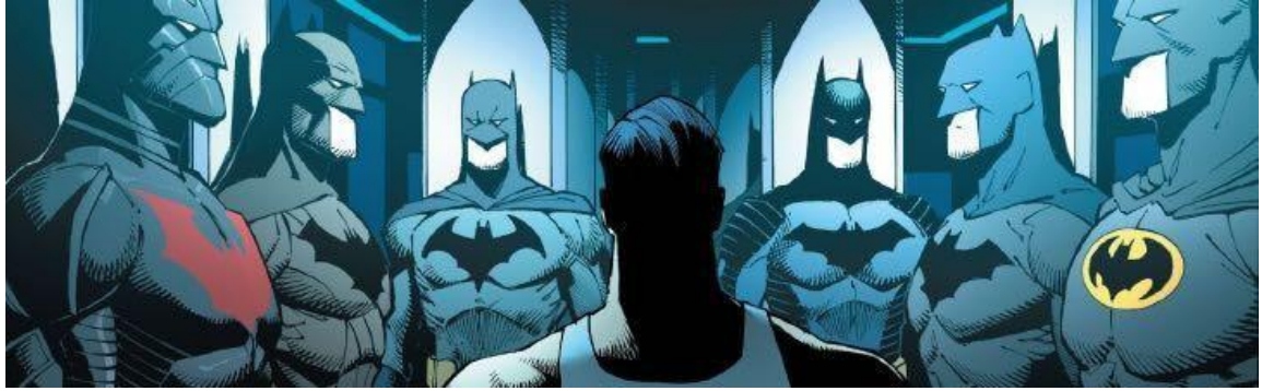
Imagen 3. “Los nuevos 52” Greg Capullo & Scott Snyder