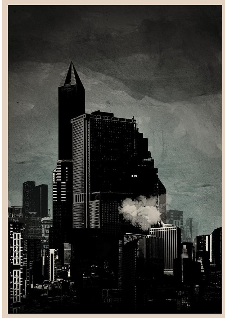
Imagen 1. "Batman: Gotham city" Peter Strain